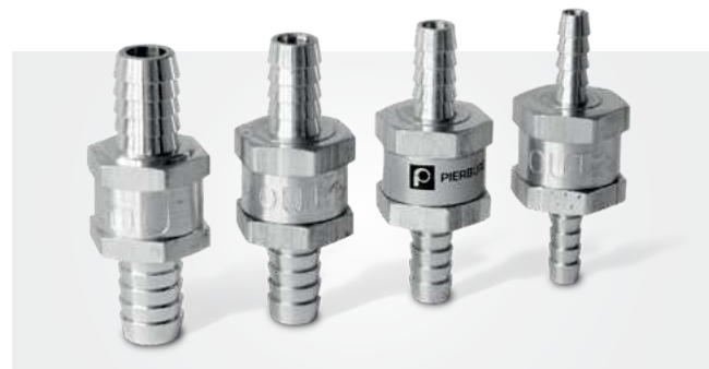
Kraftstoff-Rückschlagventile 6 – 12 mm

Keine Materialpaarungen verwenden, die zusammen mit Aluminium Korrosion oder Kontaktkorrosion auslösen: z. B. Salzwasser oder verzinkte Oberflächen.