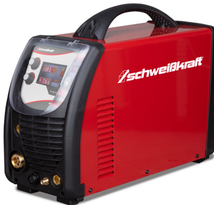
EASY-MIG 181 Multi